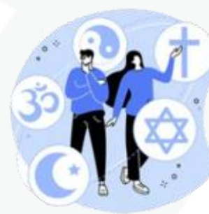
sua preferência religiosa

Agora fica fácil você compreender que o uso mal intencionado desses dados pode criar muitos problemas, como ocorre com os conhecidos golpes de boletos bancários, fraudes em contas de aplicativos, abertura indevida de contas bancárias e de consumo.