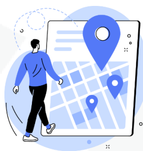
seus hábitos de deslocamento