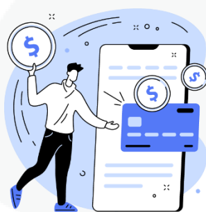
seus hábitos de consumo